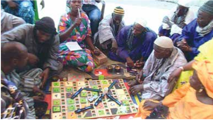
Ilustração 2. A plataforma é concebida com o intuito de permitir simulações prospectivas complexas a partir de elementos de modelagem simples, apropriadas para todos.

No final dos anos 2000, o suporte de simulação foi melhorado de forma a poder ser utilizado em grande escala em várias localidades de um país, permitindo assim uma utilização no âmbito nacional para a elaboração concertada de políticas públicas (reformas agrárias, códigos de legislação ambiental, organização das fileiras...).